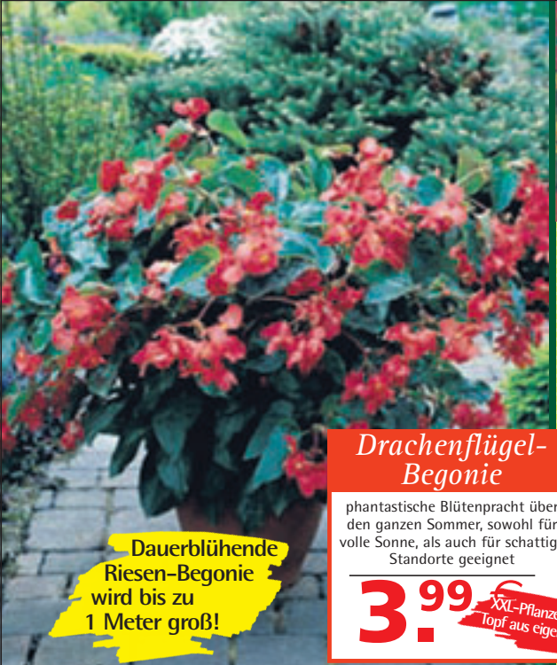
Dauerblühende Riesen-Begonie wird bis zu 1 Meter groß!